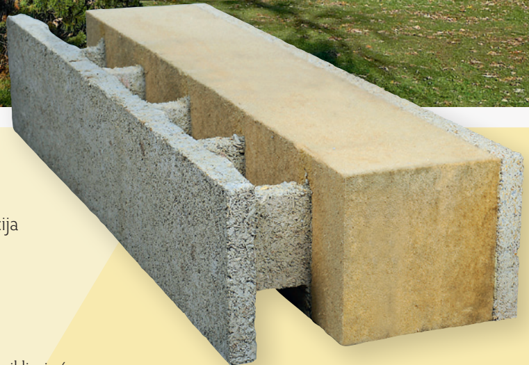
Eko-Expert s integriranom izolacijom od drvenih vlakana