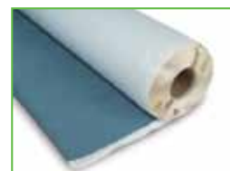
KÖSTER KSK SY 15