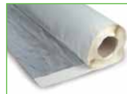
KÖSTER KSK ALU 15