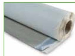
KÖSTER KSK ALU Strong