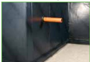
Hidroizolacija je postavljena