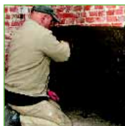
KÖSTER KD 1