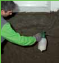
Primjena primera KÖSTER Polysil® TG 500

KÖSTER Sanacijske žbuke razvijene su posebno za sanaciju zida s visokom koncentracijom soli i vlage. One sprječavaju izbijanje soli na površinu. Ako je kapilarna vlaga prekinuta sa KÖSTER Crisin® 76, tada pomažu prilikom isušivanja zidova i kod skladištenja soli koje kristaliziraju tijekom procesa isušivanja.