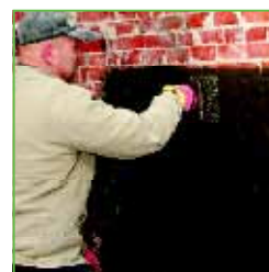
KÖSTER KD 1

Nakon brtvljenja prodora vode mora se brtviti i površina oko mjesta prodora: U tu svrhu izmiješa se toliko KÖSTER KD 1 premaza koliko se može iskoristiti unutar 10 minuta. Premaz bi trebao biti kremaste konzistencije, tako da se može dobro razmazati. Nanošenje premaza vrši se pomoću četke. Nakon toga se KÖSTER KD 2 rukom razmaže po svježem, još vlažnom premazu, dok se površina ne osuši. Odmah potom nanosi se KÖSTER KD 3 otopina sa čistom četkom. Neposredno nakon toga te još jednom nakon 30 minuta nanosi se KÖSTER KD 1 premaz. Ukupna debljina sloja ne bi trebala iznositi više od 4 mm.