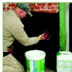
KÖSTER KD 3