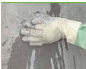
...unutar par sekundi...