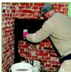
KÖSTER KD 1