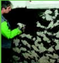
Nanošenje KÖSTER Reparturni mort