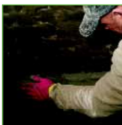
KÖSTER KD 2